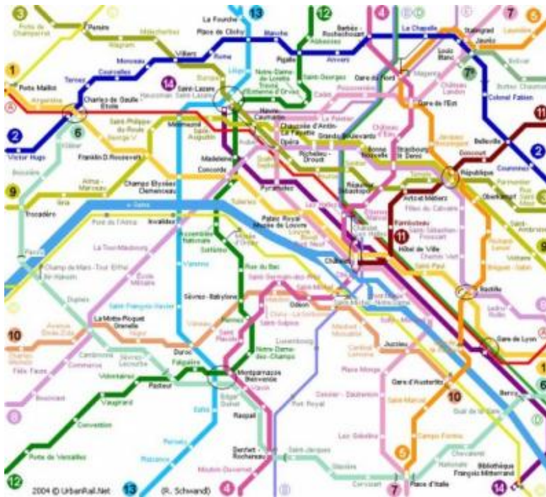
Pariška mreža metroa

Kartografske metafore se često rabe da bi se napravio red u velikoj količini obavijesti (na primjer u internetu ili bazama podataka). Ovisno o cilju i prirodi podataka koje treba prikazati mogu se koristiti različite vrste karata, npr. planovi metroa, scheme, itd.