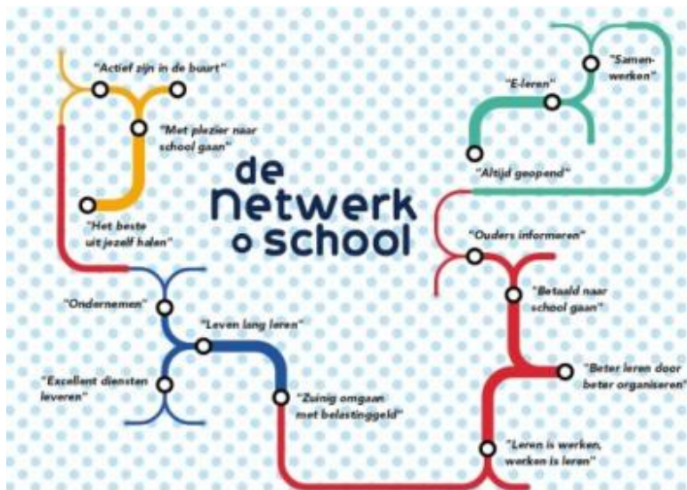
Mapping the Networkschool ( www.denetwerkschool.nl )

Karte se mogu koristiti i za prikaz razvoja, npr. nastavnikove karijere, označavajući put kroz plodna tla, pustinje, samotne planine i zelene doline.