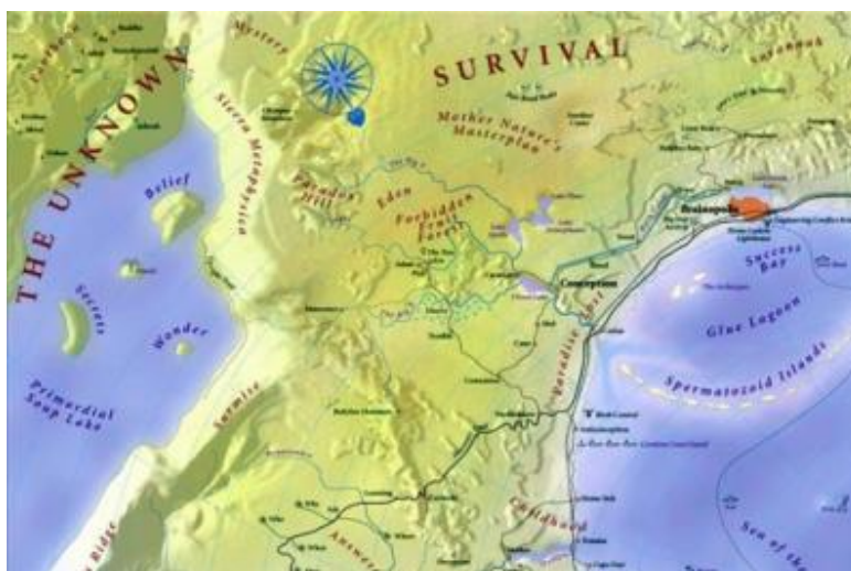
Krajobraz ljubavi ( www.landscapesoflove.com )